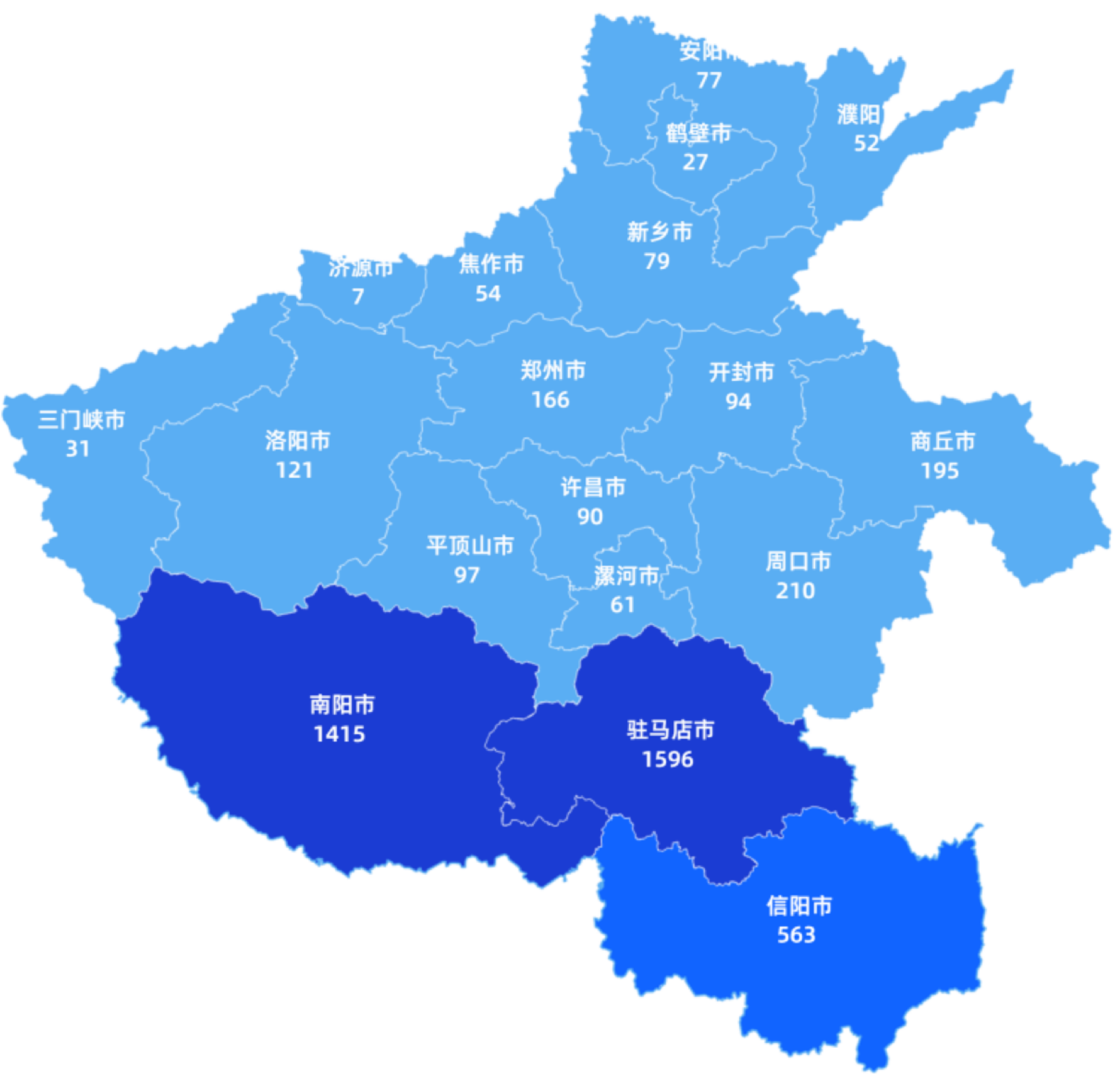
图1-2 学校2024届毕业生生源地地区分布图

学校 2024 届毕业生来自全国 7 个省份，其中省内毕业生占总人数的 99.7%，达到 4935 人，这表明其在本地区域学前教育中的核心地位。